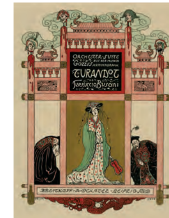
Emil Orlik: Ferruccio Busoni, Orchester-Suite Turandot op. 41, 1906