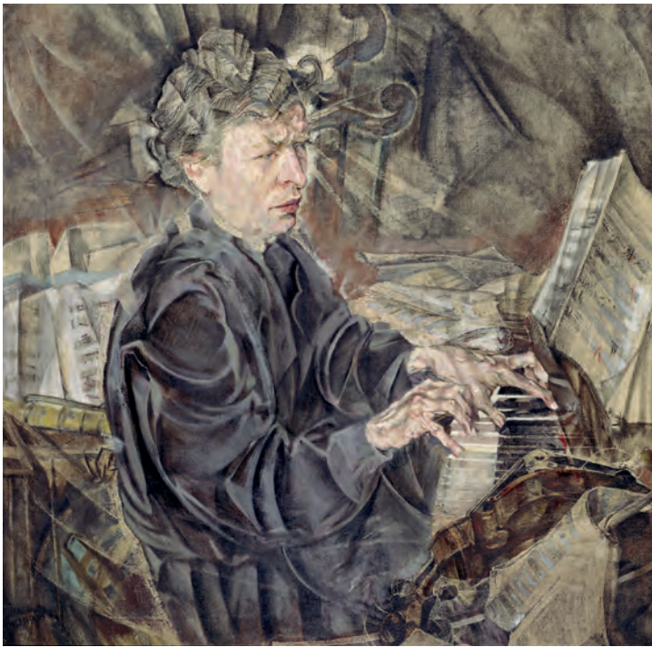
Max Oppenheimer: Ferruccio Busoni, 1916