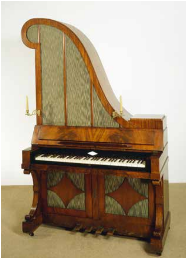
Giraffenflügel, Johann Ludwig Müller, Berlin, um 1840, Kat.-Nr. 4612