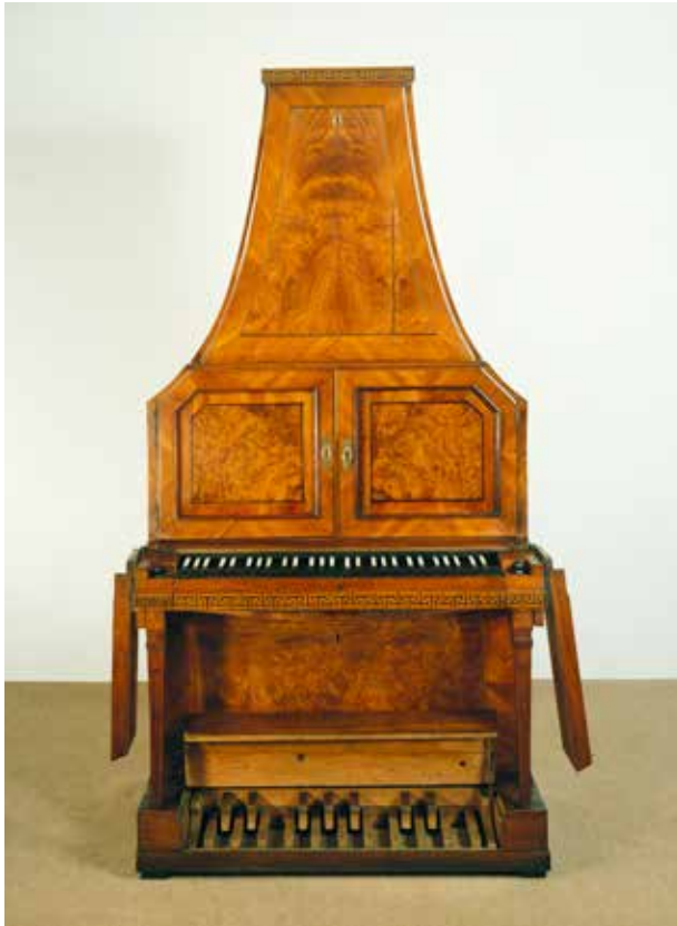
Pyramidenflügel mit Pedalklaviatur, Deutschland, um 1770, Kat.-Nr. 4878