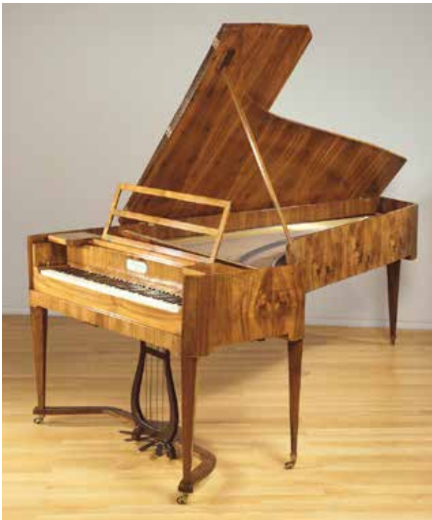
Hammerflügel aus dem Besitz Carl Maria von Webers, Brodmann, 1805/1815, Kat.-Nr. 312