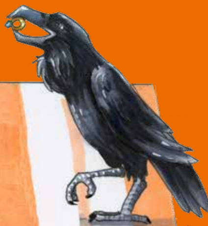
Illustration: Helene Schoof

Kosten: € 2,- (Kinder bis 18 Jahre) | € 8,- (Erwachsene) Die Teilnehmerzahl ist begrenzt. Anmeldung unter Tel.: 030.254 81-178 oder kasse@mimpk.de Altersempfehlung: 6 bis 10 Jahre